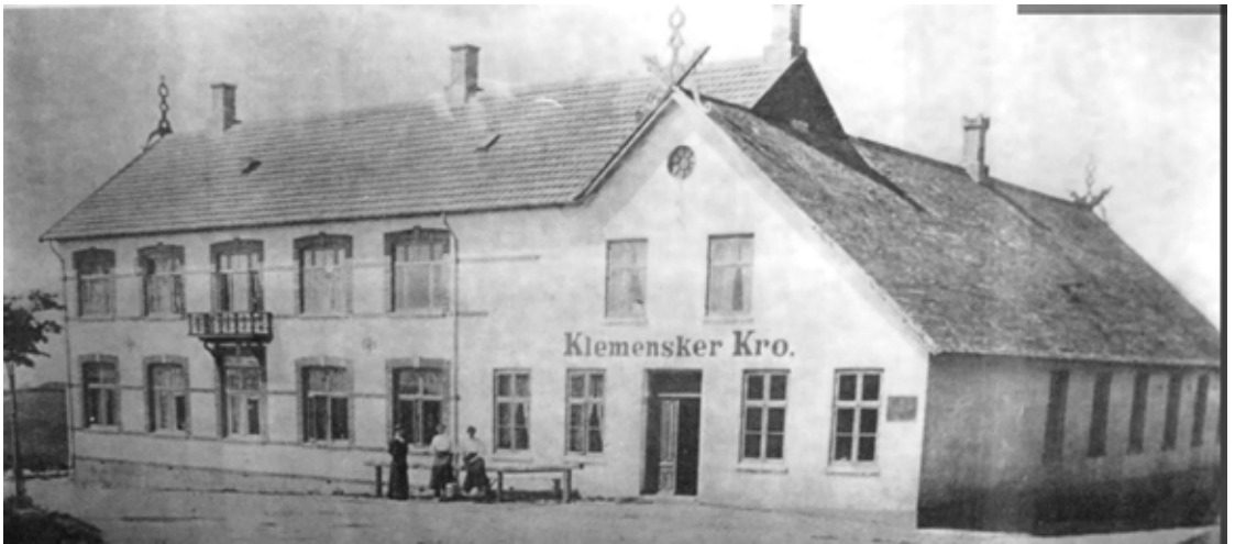
Historien om Klemens Kro omfatter mange ejere og mange ombygninger. De to etager blev opført i 1907.