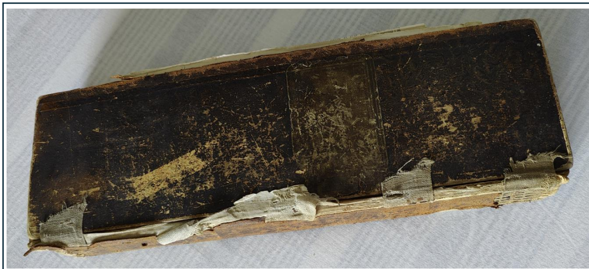
Den meget specielle bog.