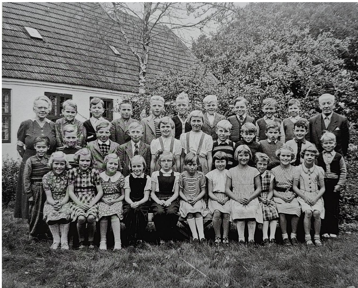
1954 - Klemensker Nordre Skole på Bolbyvej (opført 1858)

49 noteredes som fattige, hvilket ikke betød manglende læsefærdighed. Der var ingen forskel mellem kønnenes læsefærdighed og faktisk var pigerne en smule bedre læsere end drengene, da 74 af de i alt 138 gode læsere var piger. I blandt de dårligste var 34 af 65 piger. Det er bemærkelsesværdigt at Ellen Pedersdatter, der ellers var »tåbelig og sanseløs«, kunne læse. Præsten noterede ved 30 af børnene med ringe læsekundskab, at det skyldtes forældrene. Børnene »bliver iche tilholdt at lære«, »iche holdt til at lære af Forældrene« eller »forsømmes af Forældrene«