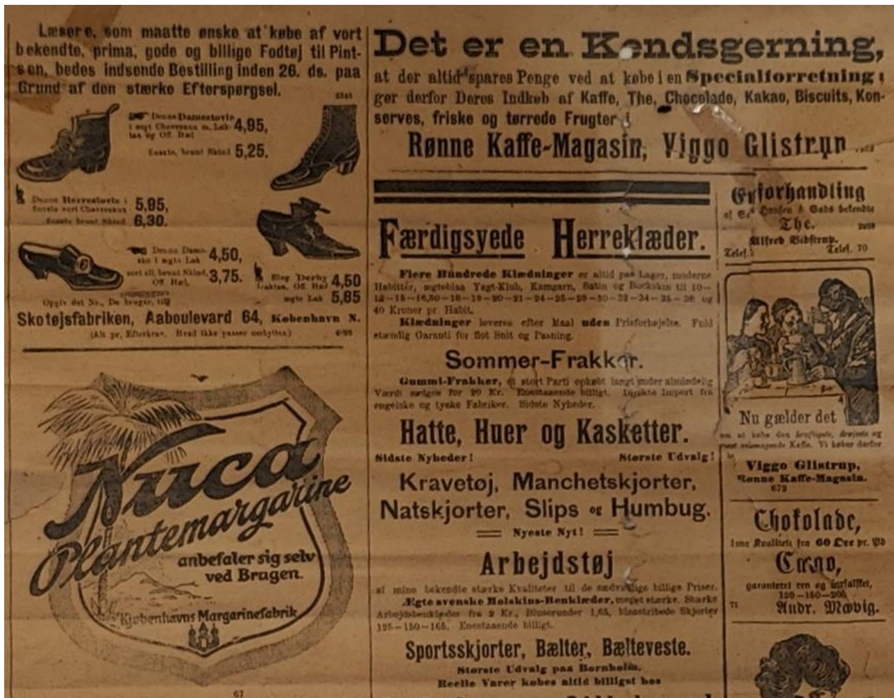
Annoncer fra 1911.