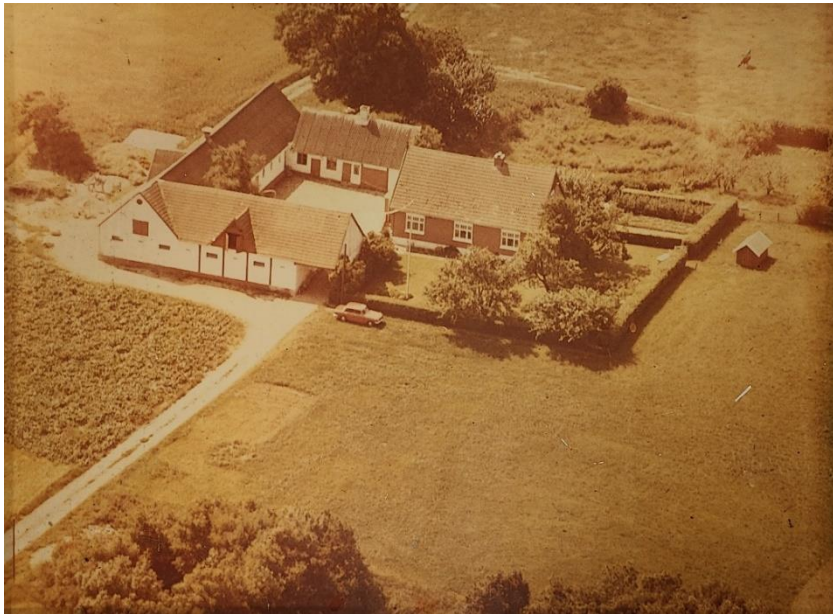
Egelund, også kaldet København.