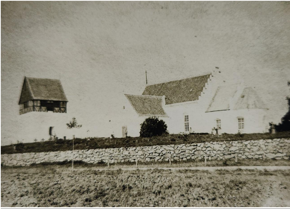
Klemens Kirke der som den først kirke på Bornholm blev revet ned i 1881.

Husk: Vi vil gerne være sidste stop før BOFA, så hjælp os med at indsamle alt af historisk værdi, inden det går tabt.