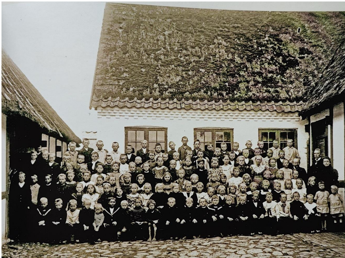
1901 - Klemensker Søndre Skole på Centralvej (1850 – 1927).

Nedenstående er "klippet" fra Bornholmske Samlingers udgivelse om "Bornholmernes Folkeskoler". Bogen er meget interessant; men indeholder desværre ikke meget om Klemenskers skolevæsen. Bogen findes og kan lånes på Bornholms Centralbibliotek.