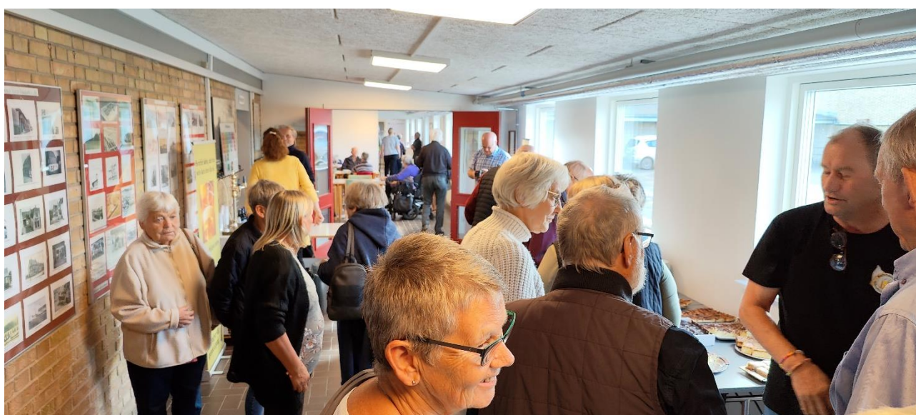
Der var kø både til kaffebordet og hos øl entusiasterne, der uddelte smagsprøver.