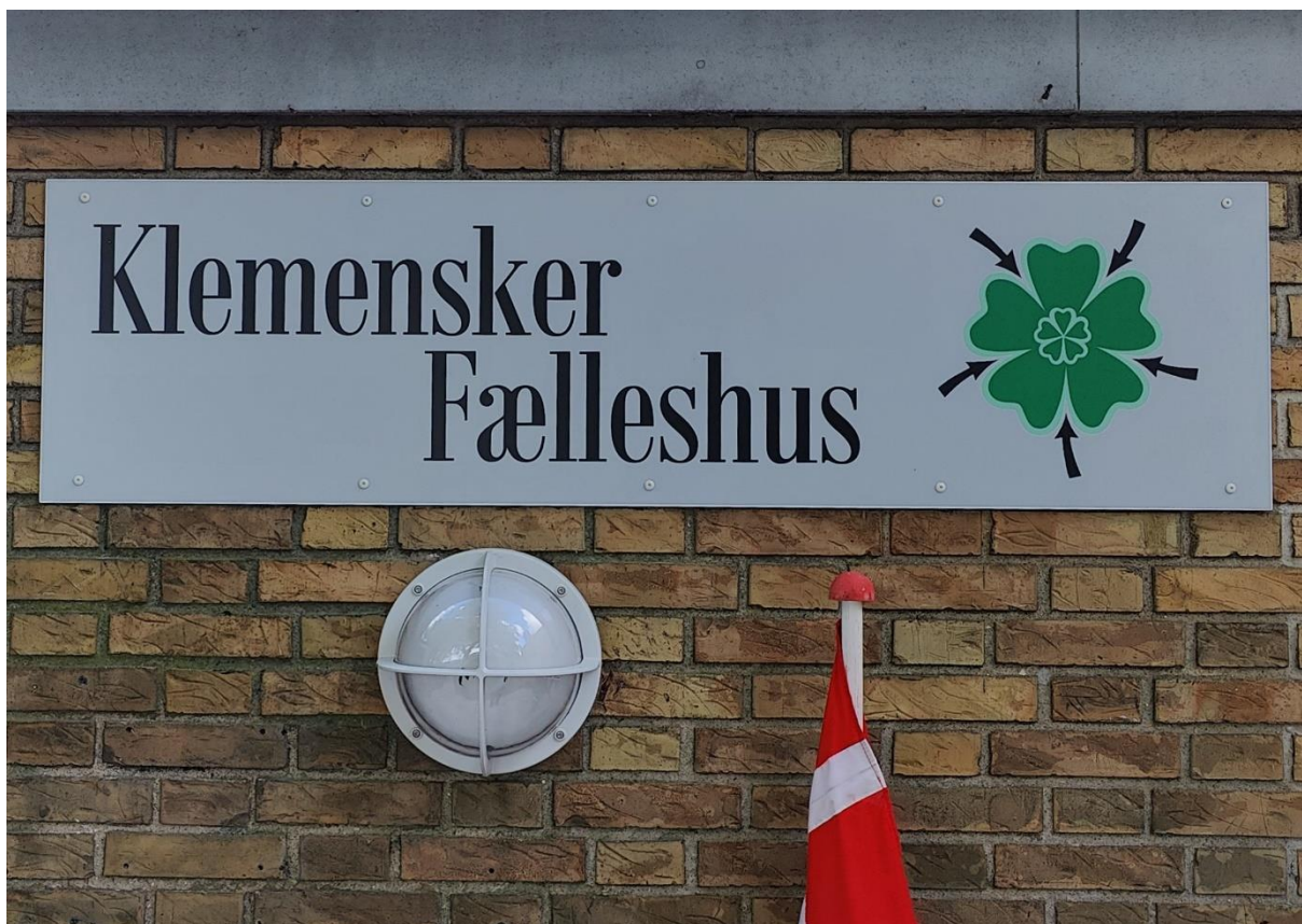
Husts nye navn.