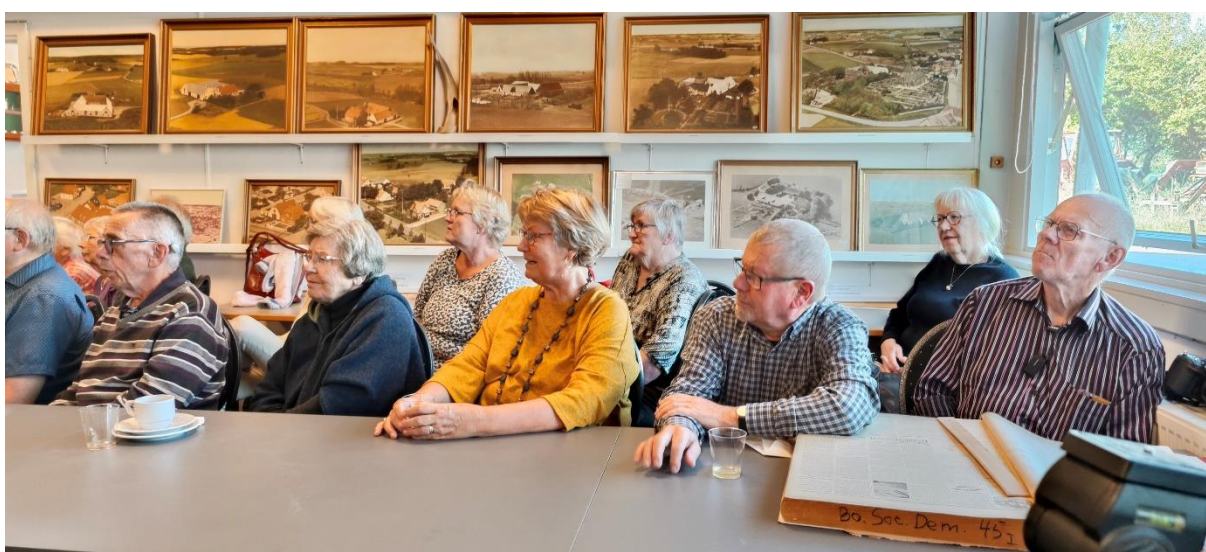
Der blev lyttet og sunget med.