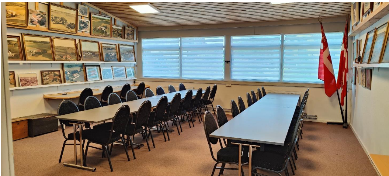
Nye borde og stole i mødelokalet.

Som sagt er vi i den heldige situation, at Bornholms Brands Fond har bevilget os penge, så vi er i stand til at få nyt inventar i mødelokalet. På billedet nedenfor ses de nye gardiner, borde og stole der er indkøbt. Da stolene ikke fylder så meget som de gamle stole, har vi nu plads til ca. 40 personer.