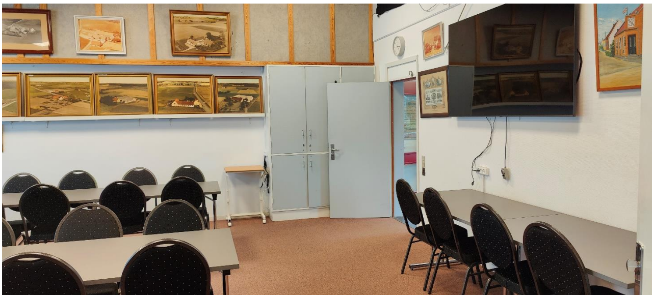
Ekstra borde og stole.

Dejligt at der er fonde der vil hjælpe os, så vi kan skabe gode vilkår for vores medlemmer og vores fortsatte arbejde med at bevare vores fælles fortid i sognet.