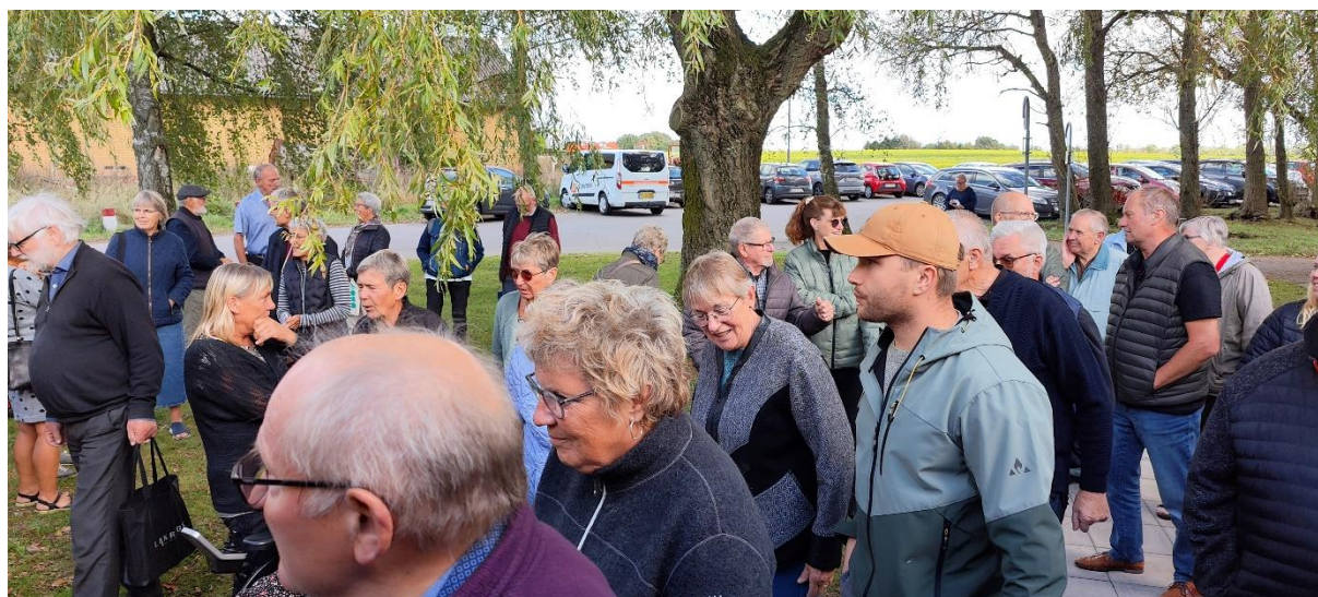
Ca. 100 mennesker mødte op til indvielsen og åbent hus.