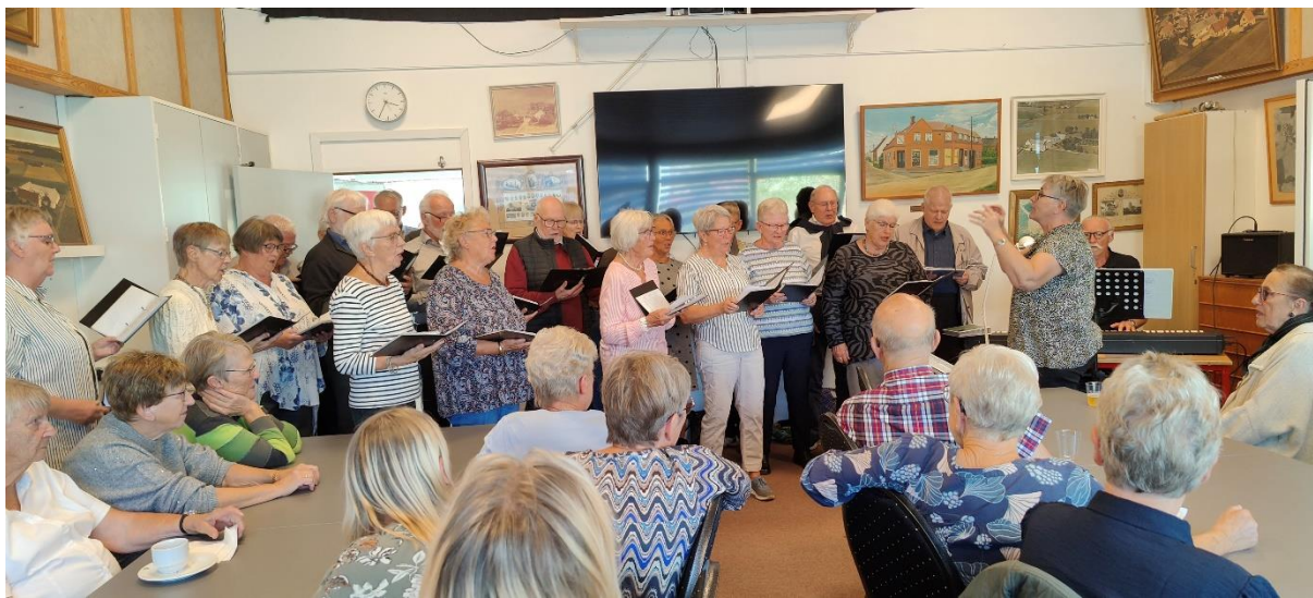
Knudskers Pensionist kor underholdt, et populært indslag.