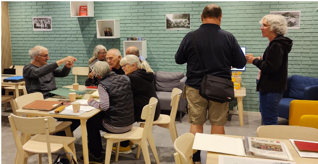
Fra mødet den fredag den 13-9-2024.

De 3 møder er nu afholdt med emnerne Gårde og ejendomme, Skoler og Erhverv. Første møde var godt besøgt, hvorimod besøget i andet og tredje møde var knap så godt. Da møderne kræver stor forberedelse, opsætning og en del personer involveret, vil der nu blive foretaget en evaluering, om møderne skal fortsætte. Det gode er, at det har givet nye medlemmer til foreningen.