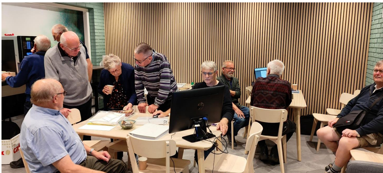
Fra mødet den fredag den 27-9-2024.