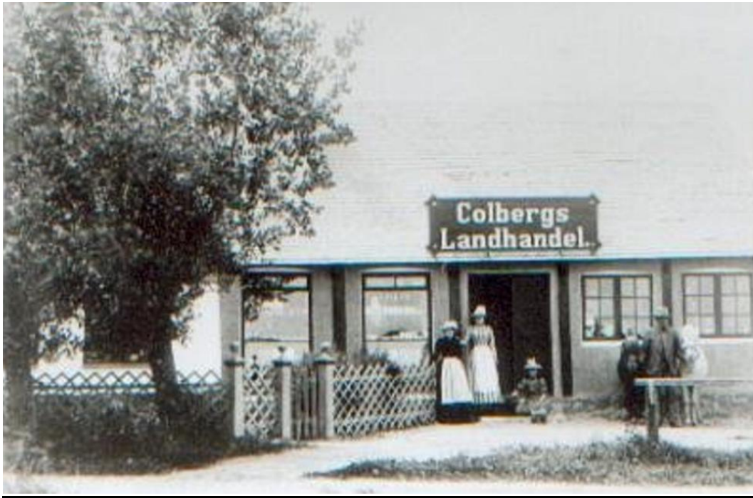
Colbergs landhandel og senere telefoncentral.