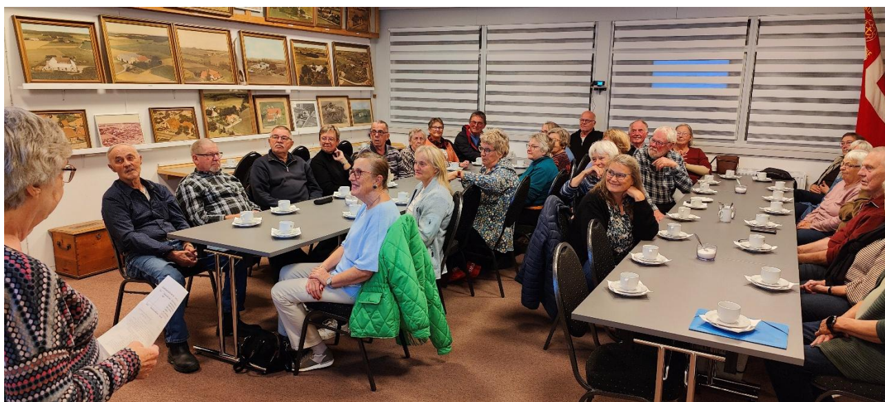
Stort fremmøde og et veloplagt publikum.