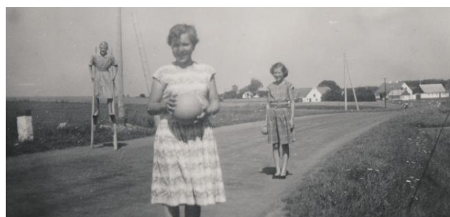
Efter vejudretningen; men stadig med telefonpæle.