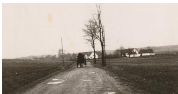
Før vejudretningen og asfaltering.