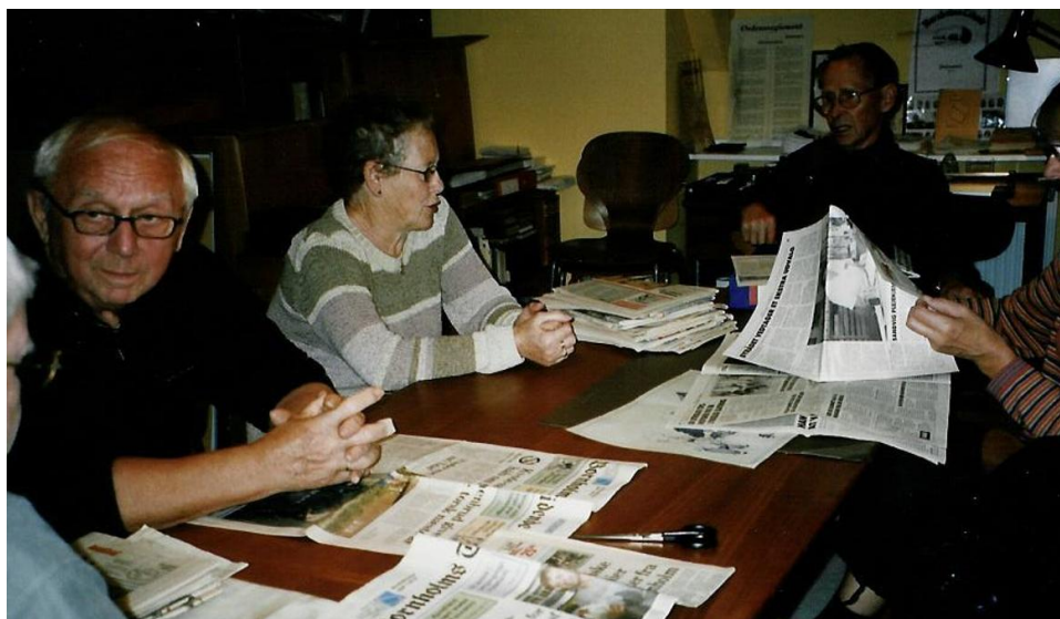
Et senere billede fra et møde i arkivet.

Efter kaffepausen var der lejlighed til at tegne sig som medlem af foreningen, hvilket alle benyttede sig af.