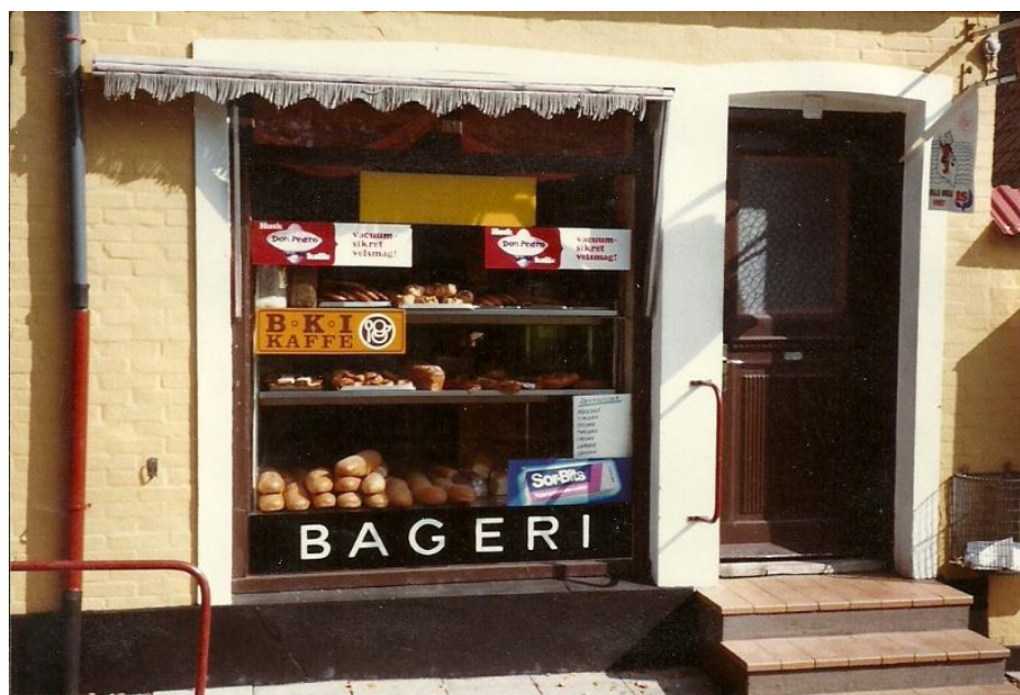
Bager Jensen i "Provstegade" (tidligere billede fra arkivet).