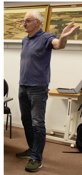
Utroligt mange detaljer blev "afsløret" under foredraget.