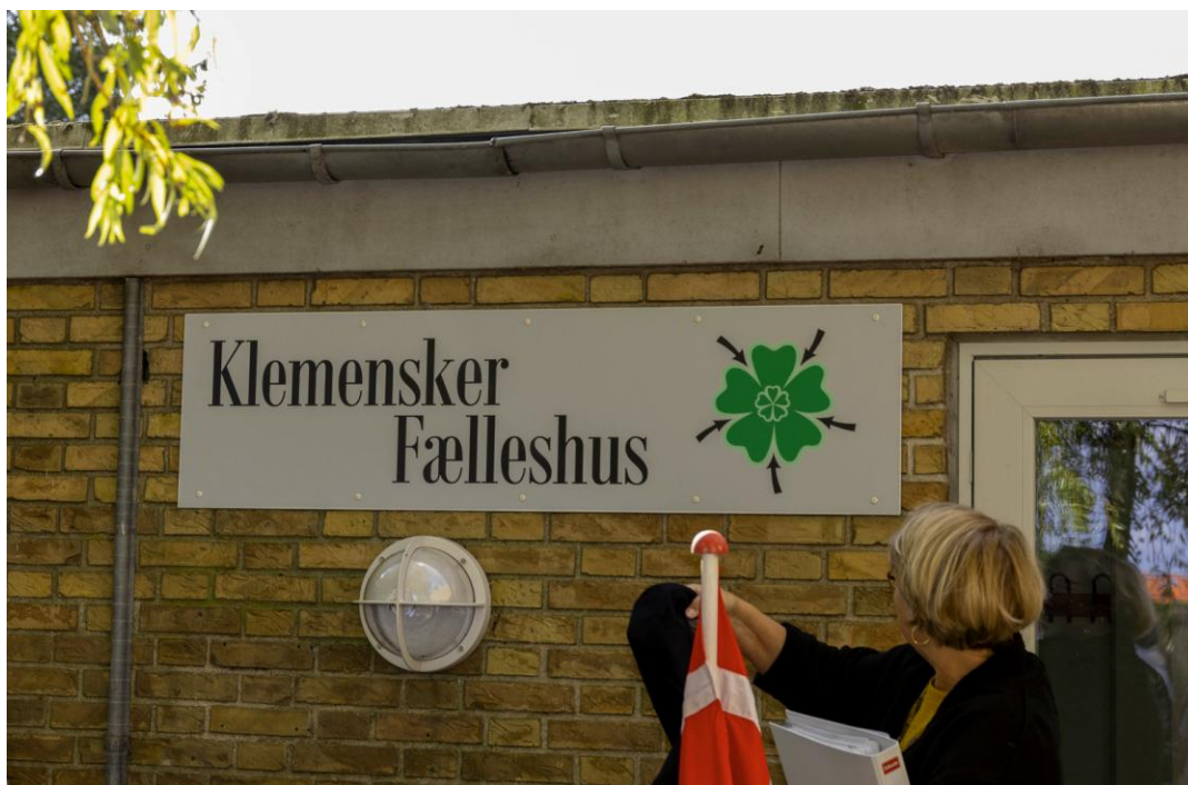
Arkivfoto fra indvielsen af Klemensker Fælleshus den 29. september 2024.

Foreningen modtager meget gerne forslag til foredrag og arrangementer.